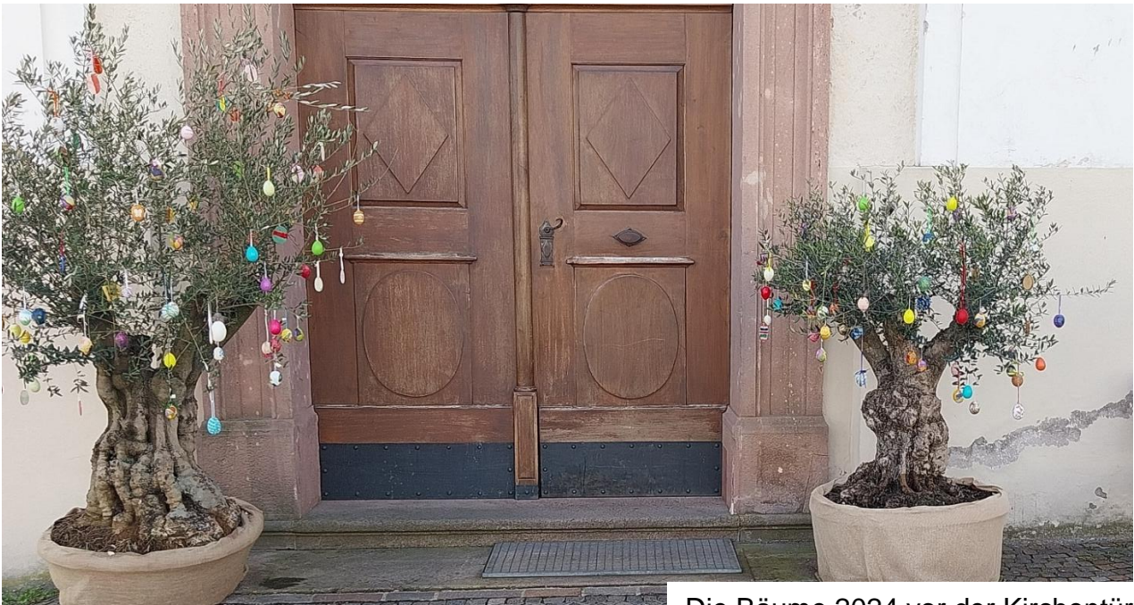
Die Bäume 2024 vor der Kirchentür

Der Brauch, Bäume und Sträucher zu Ostern mit Eiern zu schmücken, auch als Osterbaum bekannt, ist Jahrhunderte alt.